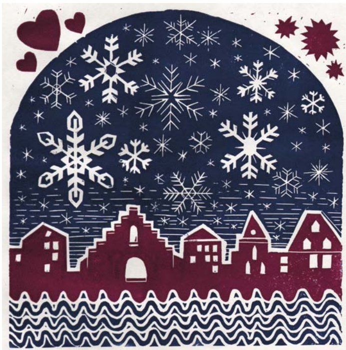
Linoleumssnit af Jens-Andreas D. Elkjær.